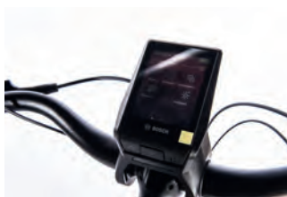
In Farbe, super ablesbar, perfekt: das neue Bosch Nyon-Display.