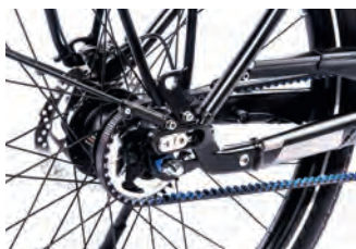
100%ige Schubübertragung dank 5-Gang-Nabe & Riemen.